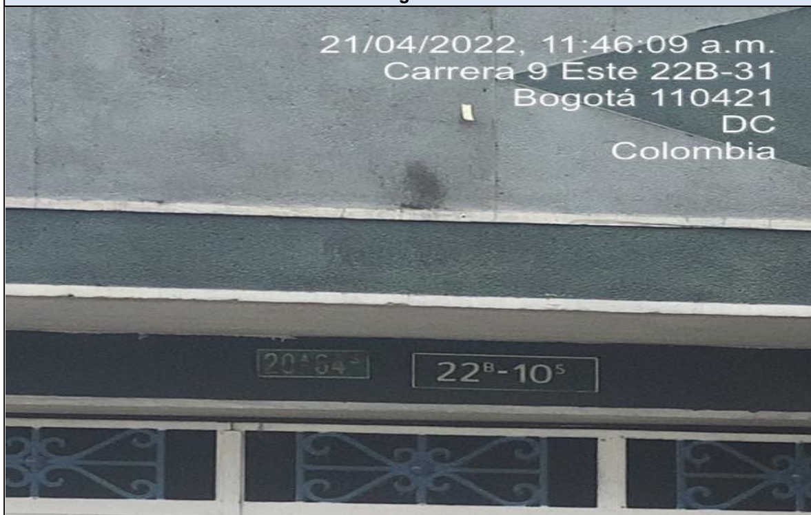
Nomenclatura urbana del predio de referencia